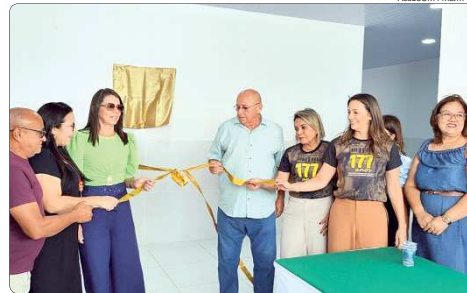
Corte da fita por autoridades, na escola do Bairro Novo