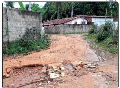
Obras foram paralisadas próximo ao restaurante Galinha Caipira.

Desde o início do mês de setembro, as obras de calçamento da rua dos Eucaliptos, na comunidade da Rocinha, estão paralisadas, pela Secretaria Municipal de Obras.