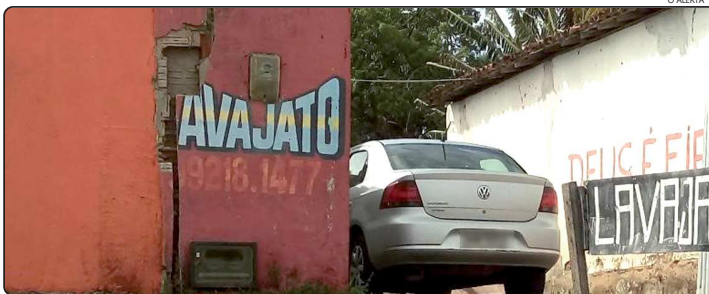
Água dos lava jatos escorre para a rua.

A água dos lava jatos que joga a água suja, misturada com óleo, proveniente da limpeza de veículos, para a