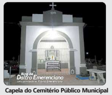
Capela do Cemitério Público Municipal

Na quarta-feira, 2 de novembro, a Igreja celebra o Dia de Finados. A paróquia de Sant'Ana e São Joaquim organizou horário das missas, na igreja Matriz e capelas das comunidades rurais de São José de Mipibu e no cemitério da sede do município.