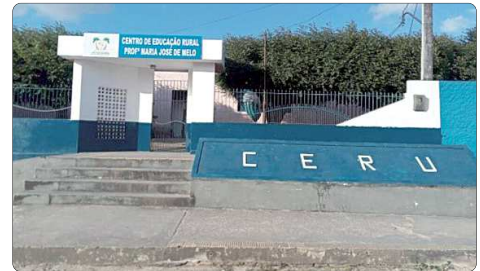
CERU atende, aproximadamente, 600 alunos