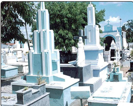
Cemitério da sede do município de São José de Mipibu está superlotado há muitos anos