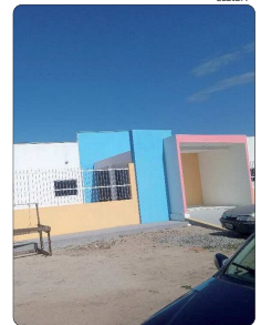
Escola " Profª Angelina Vasconcelos de Farias",

A Prefeitura Municipal de São José de Mipibu entregou aos moradores de Bairro Novo e da comunidade de Mendes, em São José de Mipibu, duas modernas e amplas escolas da rede municipal de ensino.