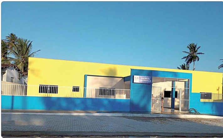
Escola Municipal Cônego Pedro Paulino, no Mendes