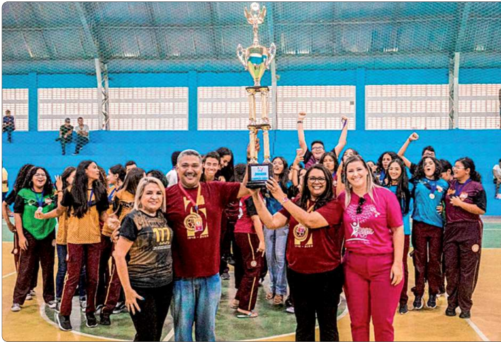
Instituto Pio XII foi o campeão geral

A solenidade de encerramento dos Jogos Escolares Mipibuenses contou ainda com diversas apresentações culturais realizadas pelas escolas participantes.