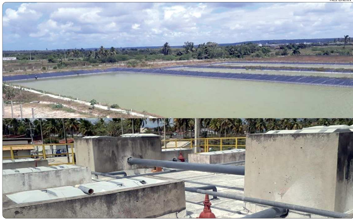
Estação de Tratamento do Sistema de Esgotamento Sanitário de São José de Mipibu

A Caern deve concluir nos próximos meses as obras de implantação do Sistema de Esgotamento Sanitário de São José de Mipibu, na região metropolitana de Natal, que há 14 anos vem sendo executadas no município.